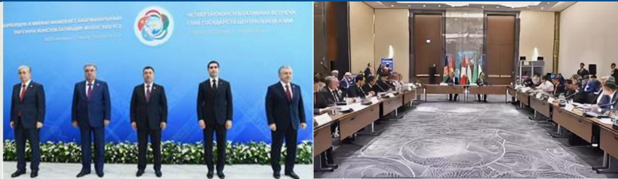
Главы государств Центральной Азии и процесс переговоров