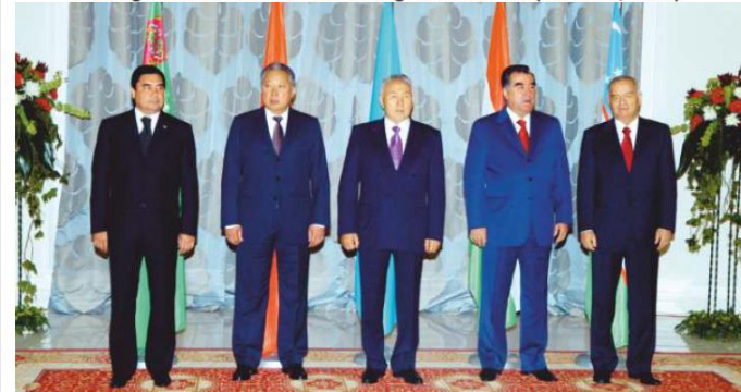
Summit of the Heads of the Founding States of IFAS (2009)