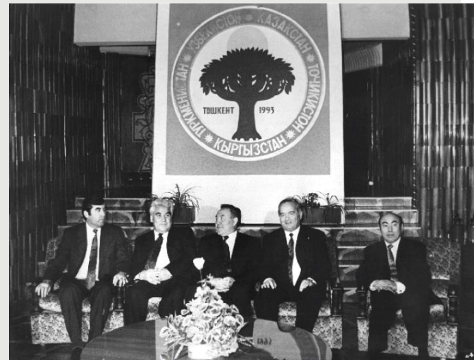
Meeting of the Heads of the Founding States of IFAS (Tashkent, 1993)